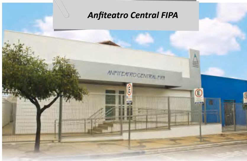
Anfiteatro Central FIPA