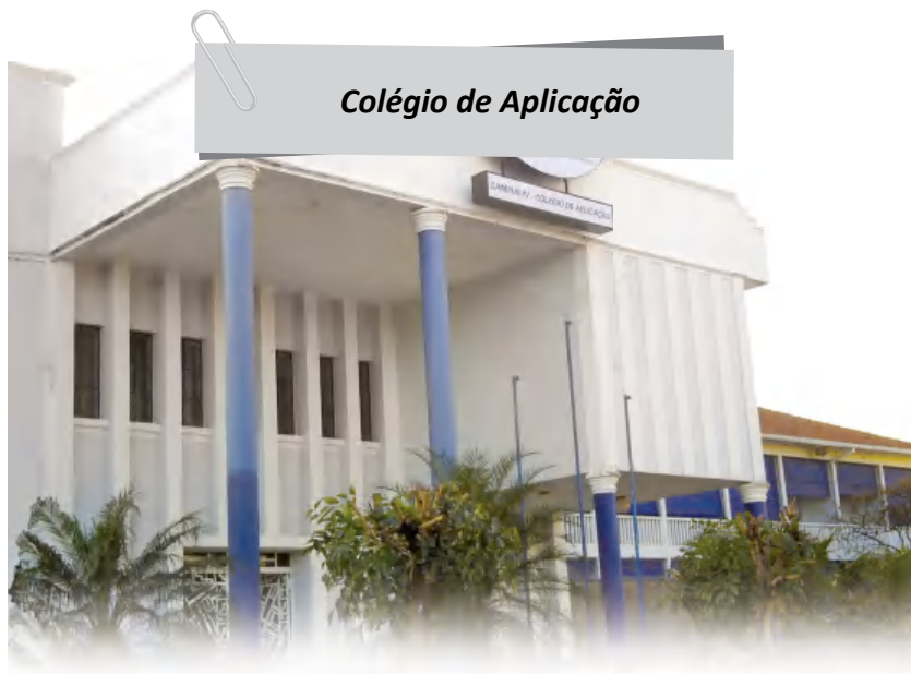
Colégio de Aplicação